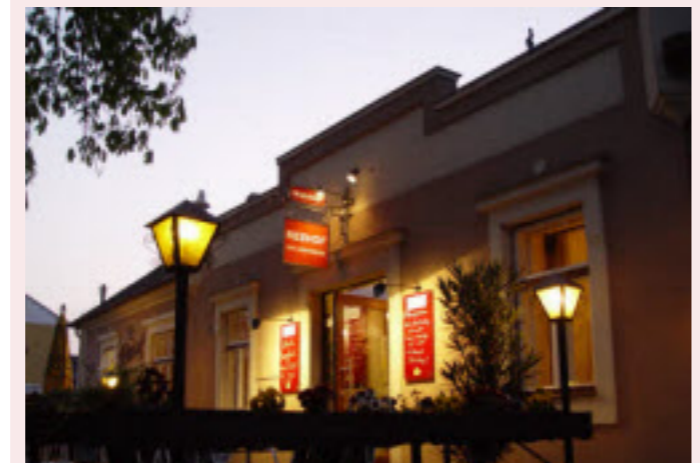
Der Rebhof Scheider bietet eine wechselnde Spezialitäten-Karte an

Öffnungszeiten: Mo bis Fr: 11 bis 23 Uhr, Sa bis So: 10 bis 23 Uhr, Mittwoch: Ruhetag; Bade- ner Straße 1, 2523 Tattendorf, ☎ 02253/81428, www.rebhof.at Wildwochen: 1.10. bis 5.11., Ganslessen: 6.11. bis 16.11.