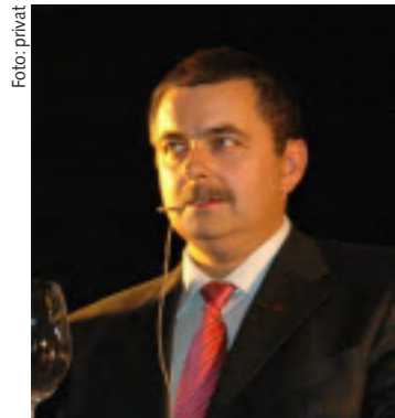
BGM - LEOPOLD AUER 2523 Tattendorf Pottendorfer Straße 14 www.weingutauer.at Tel.: 02253/81251 Fax: DW-4